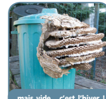
...mais vide... c'est l'hiver !