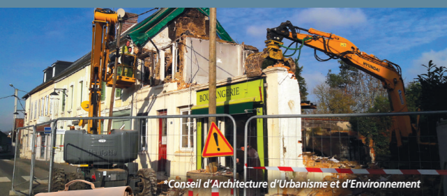
Conseil d'Architecture d'Urbanisme et d'Environnement