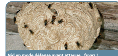
Nid en mode défense avant attaque.. fuyez !