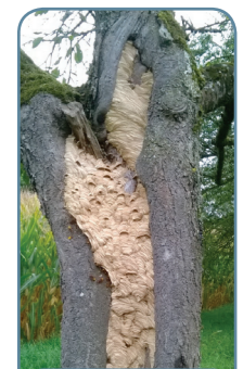
Vélo, abris, poubelle, arbres... les nids se cachent partout, mais sont très généralement en hauteur !